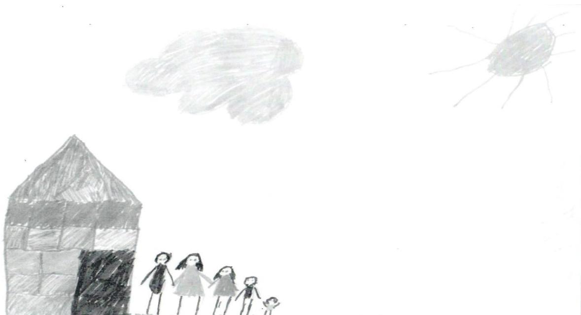
Рисунок 1 – Пример теста «Рисунок семьи», мальчик 8 лет.

После проведения диагностики, специалист интерпретирует рисунок, в комплексе с другими методиками, и при необходимости подготавливает план коррекционных мероприятий тех сфер, которые требуют коррекции, исходя из результатов методик.